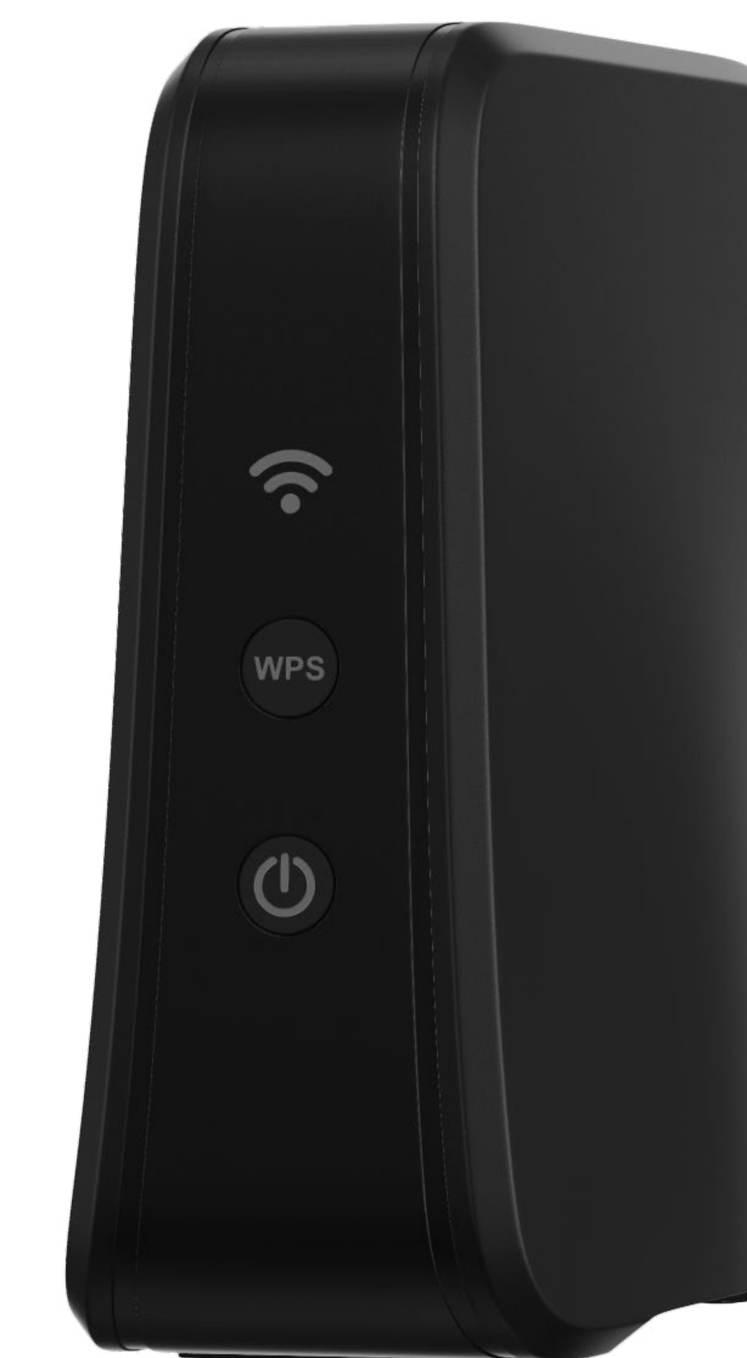
répéteur Wi-Fi 7 de la Box 10+

Inclus dans l'offre SFR Box 10+, les 2 répéteurs Wi-Fi 7 bi-bande étendent la couverture d'une pièce à l'autre du domicile permettant à tous les membres de la famille de bénéficier d'une qualité de connexion optimale quel que soit l'endroit où ils se trouvent.