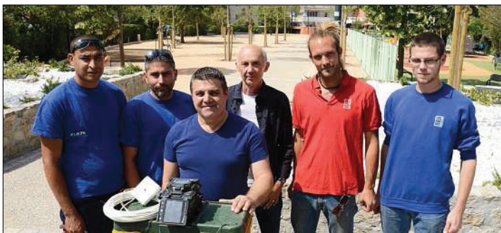
ASC et ses partenaires ont débuté par Mougins-le-Haut.