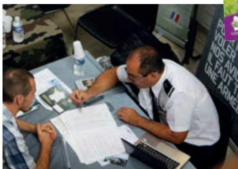
Chaque année, l'armée recrute et tient un stand.