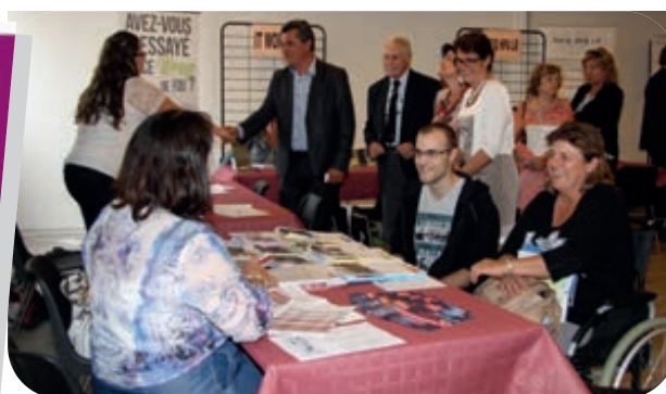
Les partenaires sociaux de la Maison du Travail Saisonnier ont répondu à toutes les questions relatives à la réglementation du travail.

2000 offres d'emplois étaient à pourvoir en stations de montagne, mais aussi au niveau local, national et international.