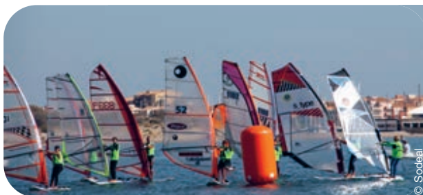
Cette régata a été couplée avec le critérium départemental du centre nautique du Cap d'Agde. Outre les bateaux habitables de 8 à 14 m, la voile légère a été à l'honneur avec des optimistes, des petits catamarans et des planches à voile qui ont disputé le critérium.