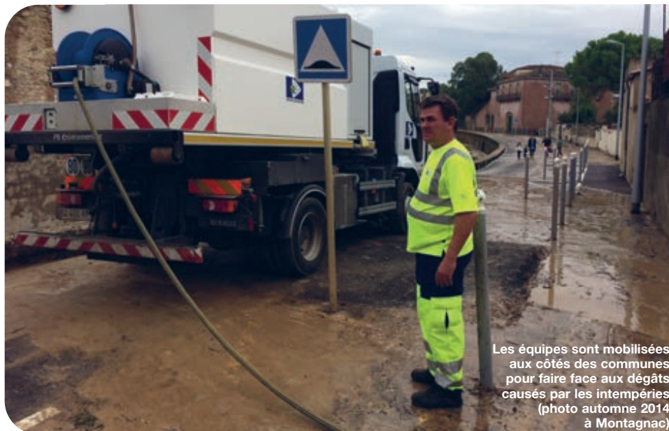
Les équipes sont mobilisées aux côtés des communes pour faire face aux dégâts causés par les intempéries (photo automne 2014 à Montagnac)

Sous l'impulsion de la préfecture de l'Hérault, l'Agglo a mis en place un chantier d'insertion pour entretenir les cours d'eau et réparer les dégâts liés aux intempéries de la fin de l'année 2014. Ce chantier a démarré en mai pour s'achever en octobre dernier. Douze bénéficiaires sont intervenus à Florensac, Agde, Bessan et Montagnac. Sur cette dernière commune, les agents