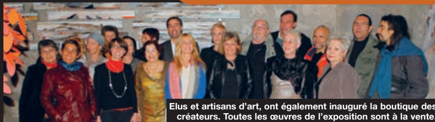
Elus et artisans d'art, ont également inauguré la boutique des créateurs. Toutes les œuvres de l'exposition sont à la vente.

Horaires d'ouverture de la boutique : D'octobre à avril tous les jours du mardi au samedi de 10h à 13h et de 14h à 18h. De mai à septembre tous les jours sauf lundi, de 10h à 13h et de 14h à 19h.