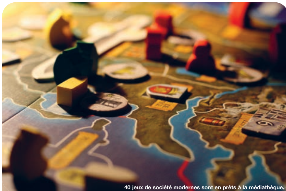
40 jeux de société modernes sont en prêts à la médiathèque.

Il y a toujours des dés, des cartes, de l'aléatoire... mais en aucun cas cela ne constitue une raison suffisante pour perdre ou pour gagner. Il vous faudra employer des stratégies, être rapide, ou encore... être drôle !