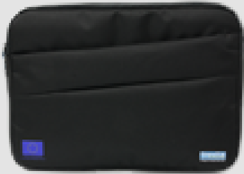
Housse de protection