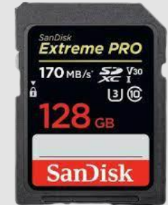
Carte SD 128 Gb