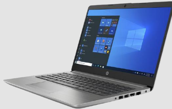
PC HP 245 G8