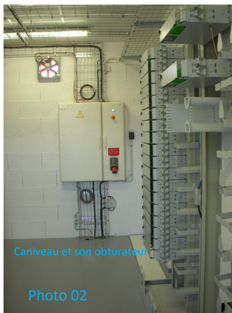
Caniveau et son obturateur