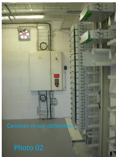
Caniveau et son obturateur