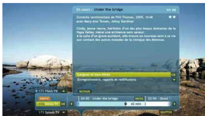
Un bandeau de zapping qui permet de consulter instantanément les programmes en cours sur les autres chaînes.