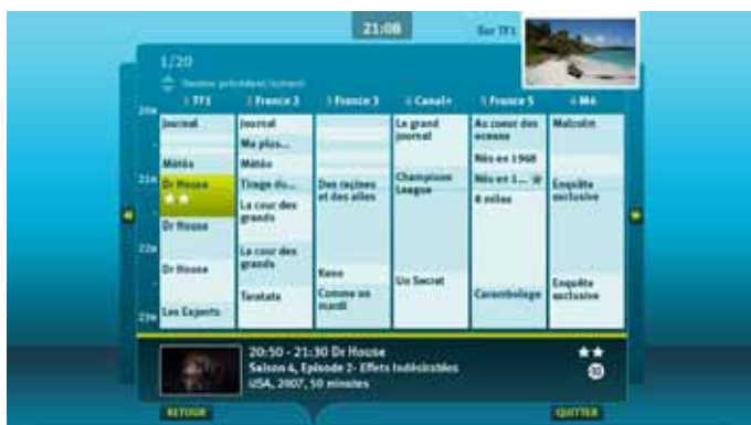
Un guide des programmes qui facilite la consultation des grilles et permet de programmer un enregistrement en un clic.

Disponible pour tous les clients Bbox (ADSL et fibre), elle inclut notamment :