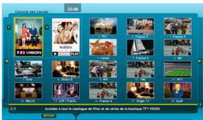
Une mosaïque qui permet de visualiser en un clin d'œil les premières chaînes de l'offre Bbox.