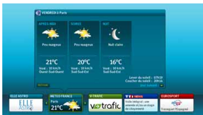
Le service multimédia «m@TV» : il permet à l'ensemble des clients Bbox TV d'accéder rapidement à des contenus web depuis leur TV (Météo France, V-Trafic, Eurosport, Closer, Elle Astro, TF1 News et Boursier.com). Le service s'enrichira rapidement de nouvelles applications.

Enfin, un service de media center sera prochainement disponible 5 , pour permettre d'accéder à tous ses contenus multimédias directement sur le téléviseur.