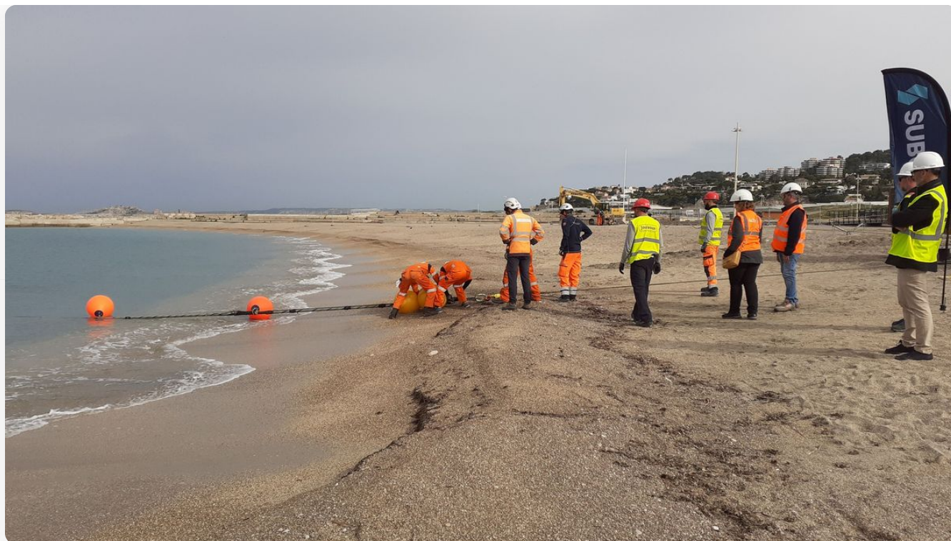
Un câble sous-marin a été installé ce lundi sur les plages du Prado

Son nom ressemble presque à celui d'un robot dans Star Wars ... Le câble "Sea-me-we-6" a été installé ce lundi matin sur les plages du Prado à Marseille. Ce câble sous-marin doit offrir un très haut débit internet , et relier à terme Marseille à Singapour, en passant par l'Égypte.