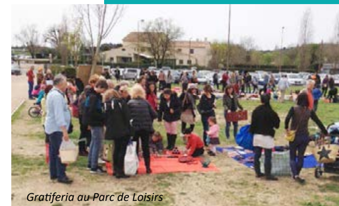
Gratifieria au Parc de Loisirs

En avril dernier, le CCAS a aussi organisé en partenariat avec l'association Colibri06, un nouvel évènement : Gratifieria. Un marché gratuit où chacun apporte ce qu'il veut donner et repart avec ce qui lui plaît. Une belle façon de donner une nouvelle vie aux objets. Prochaine édition le 6 avril.