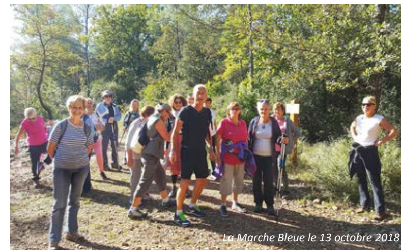
La Marche Bleue le 13 octobre 2018

2018, une année toujours active pour les seniors d'Opio. Le CCAS a reconduit ses initiatives et rendez-vous conviviaux permettant à nos aînés de sortir, de se rencontrer et de rester dynamiques.