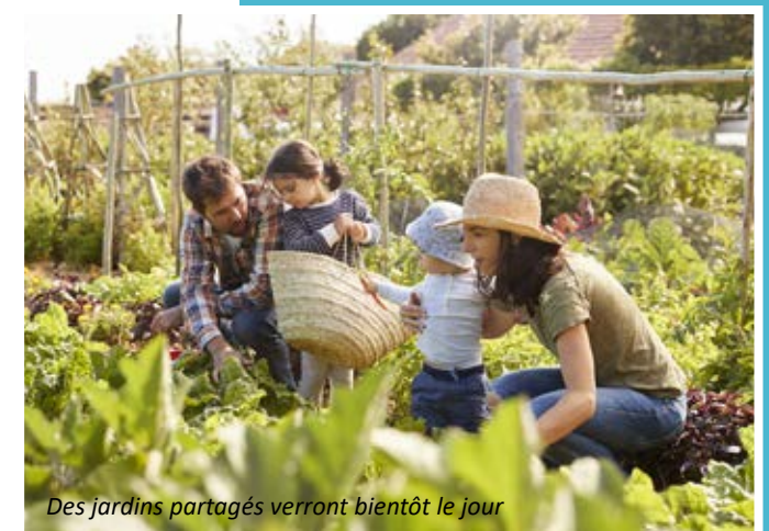
Des jardins partagés verront bientôt le jour