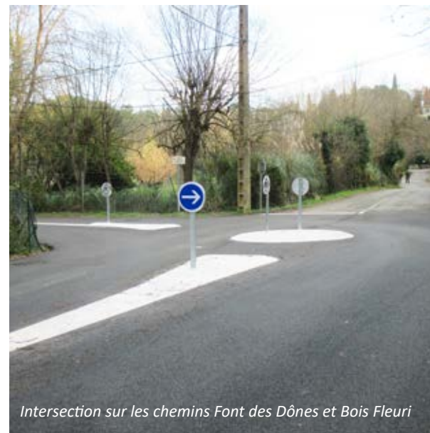
Intersection sur les chemins Font des Dônes et Bois Fleuri

➔ Par ailleurs, sur les chemins Font des Dônes et du Bois Fleuri, la Mairie a sécurisé l'intersection en créant un mini giratoire ayant pour objectif de ralentir les automobilistes et de mieux organiser la circulation, dense aux heures de pointe du matin et du soir. Les travaux se sont déroulés en décembre avec