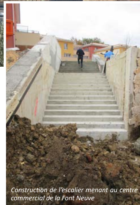
Construction de l'escalier menant au centre commercial de la Font Neuve

L'installation des clôtures et la plantation des végétaux apporteront la touche finale au projet notamment avec l'ouverture d'un jardin partagé. La volonté municipale était effec-