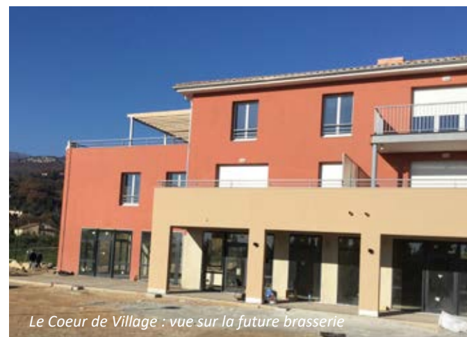
Le Cœur de Village : vue sur la future brasserie

Un bassin et un robinet seront également installés pour l'arrosage (récupération de la surverse du bassin supérieur), de même qu'une zone réservée au compostage.