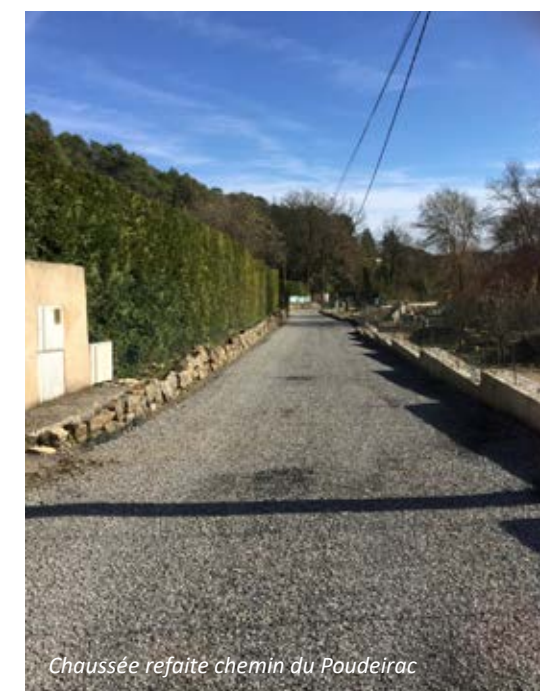
Chaussée refaite chemin du Poudeirac

➔ Toujours en matière de voirie, des travaux de réfection de l'enrobé du chemin du Poudeirac ont été engagés en fin d'année.