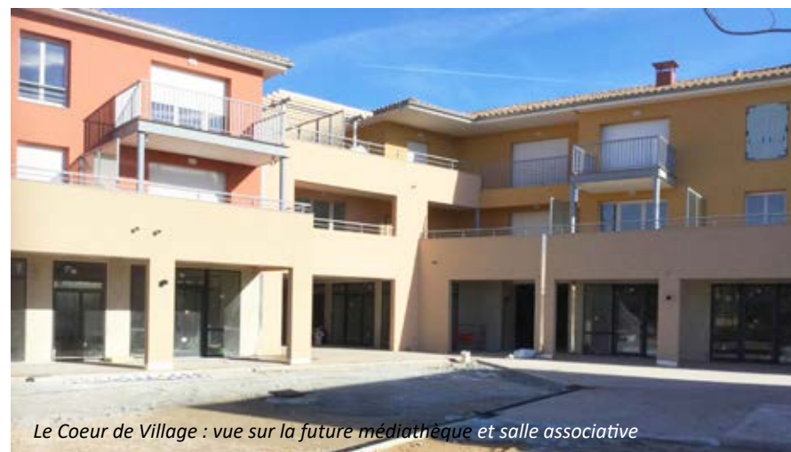
Le Cœur de Village : vue sur la future médiathèque et salle associative

Attendue avec impatience, la Médiathèque se concrétise à la satisfaction de tous, et sera, à n'en pas douter, un nouveau lieu de culture et de loisirs très apprécié.