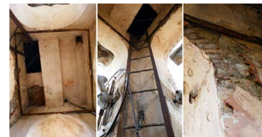
Clichés des outrages du temps à l'extérieur et à l'intérieur de l'Eglise Saint Trophime