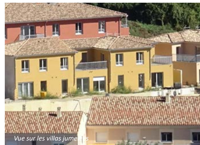
Vue sur les villas jumelées