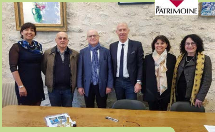
Signature de la convention avec la Fondation du Patrimoine