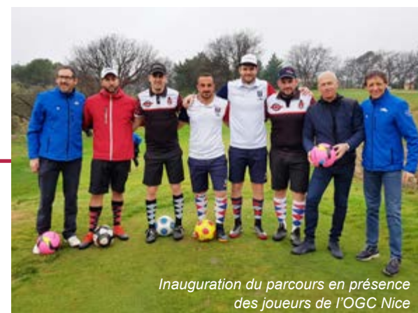
Inauguration du parcours en présence des joueurs de l'OGC Nice

Sur réservation et selon disponibilités à : clubmed.golfdelatourdopio@hotmail.fr